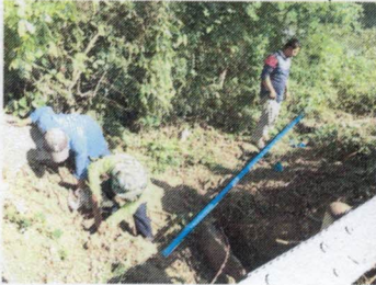
ชุมชนตะขบ