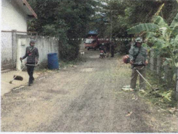
ชุมชนสำโรงตะวันออก