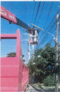
ชุมชนลำโรงตะวันออก